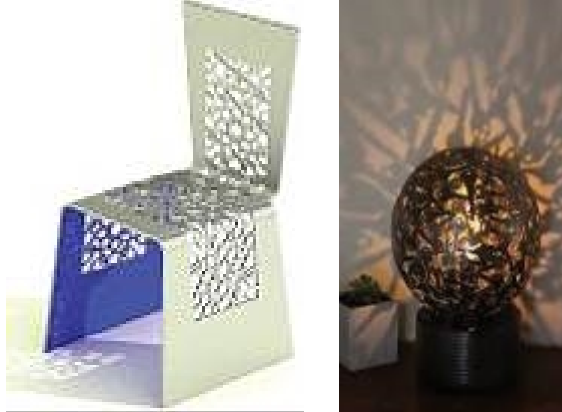
صورة (١٦) توضح تأثير تصميم كرسي المدخل بوحدة إضاءة عبارة عن عمل فني نحتي تشكيلي ويظهر التأثير بوضوح في الخامة المستخدمة والتفريغ التشكيلي والسطح اللامع المصقول . ٢- أثر أهم الطرز المعمارية المعاصرة على فلسفة تصميم كرسي المدخل:

أصبح التصميم المعماري المعاصر مبهرًا ومعبرًا عن ثورة العصر التكنولوجية وفتح سقف التقنية الذي أصبح غير محدودًا أو مقيدًا، فقد أصبحت الإمكانيات لا نهائية في التنفيذ مما كان له أكبر الأثر على فكر المصمم، فأصبح التنفيذ ليس عائقًا، حيث أصبحت الأساليب التنفيذية محدثة ومرنة ومتوافقة تمامًا مع أحلام وطموحات المصممين .