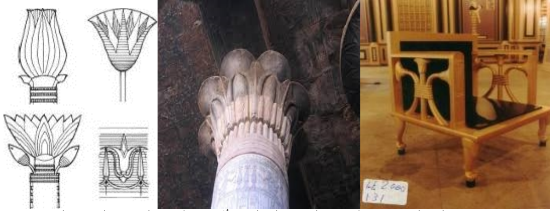
صورة (١٧) توضح وجود الإستلهام العضوي في العمارة والتصميم الداخلي والأثاث في العصر المصري القديم بشكل قوي، مما يؤكد على حداثة الفكر التصميمي الفرعوني والمشابه للفكر التصميمي المعاصر

وهو ما يظهر واضحا جليا في التصميم المعماري وتصميم الأثاث الخاص بهم (٣) .