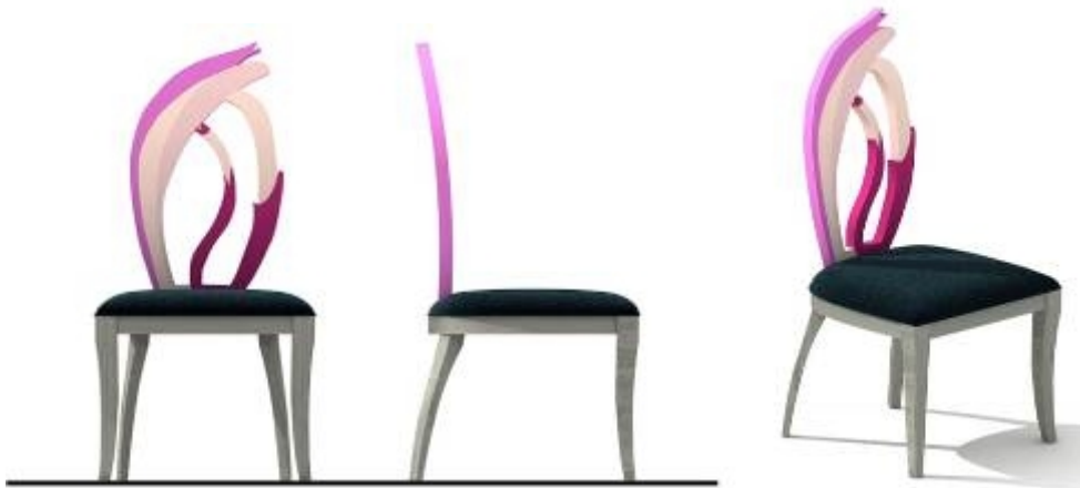
تصميم كرسي مدخل رقم (١٣)

الإلتزام بالقوالب الجامدة وهو ما تميزت به التصميمات المعاصرة فالتصميم أصبح لا يحد من إنطلاقه خامة أو تقنية أو صعوبة الحصول على تأثيرات أو درجات لونية فقد أصبح بفضل الله والثورة التكنولوجية كل شيء متاح .