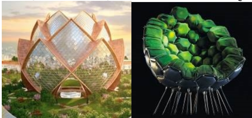
صورة (٢٠) توضح العمارة العضوية المستلهمة من العناصر الطبيعية فنلاحظ المبنى المستلهم من نبات الخرشوف وتصميم الكرسي المواكب لنفس الفكر التصميمي والمصنوع من الخامات المخلفة القابلة للتشكيل والذي تم في تصميمه الدمج بين العنصر الطبيعي النباتي وكرة حفظ الإبر مما يؤكد على أن التصميم الحديث أصبح بحرا مفتوحا مترامي الأطراف تعددت فيه مصادر الإستلهام .