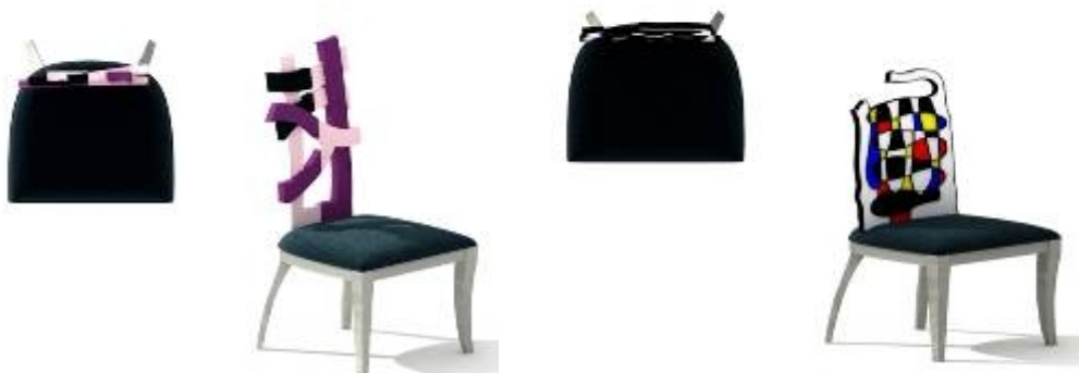
تصميم كرسي مدخل رقم (٥)