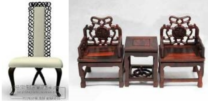
صورة (٧) توضح نماذج منتقاه بعناية من الكراسي ذات الطابع الآسيوي تتضح فيها السمات الطرز الآسيوية (١٠).