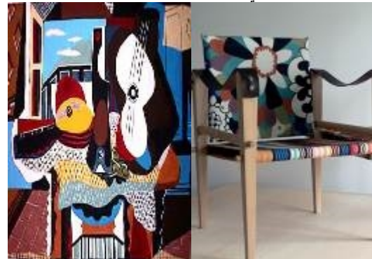
صورة (١٣) توضح تأثير تصميم كرسي المدخل بالفن التشكيلي في المدرسة التكعيبية .