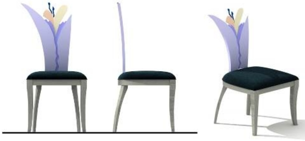
تصميم كرسي مدخل رقم (١١)