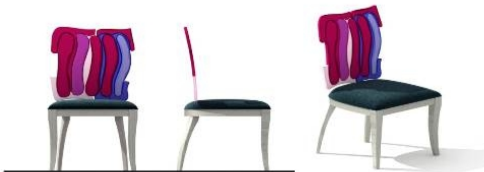
تصميم كرسي مدخل رقم (١)