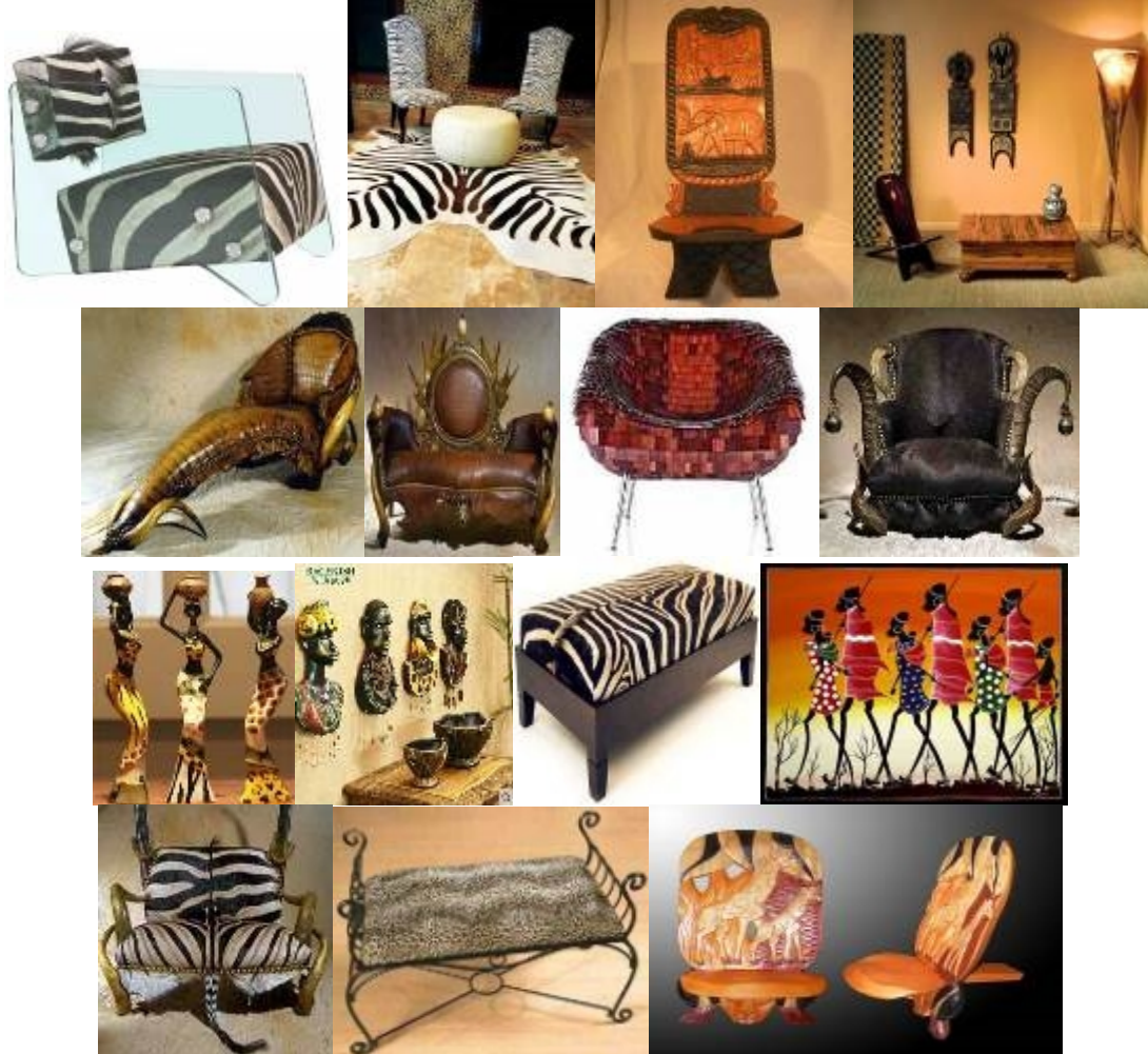
صورة (٨ب) البصمة الإفريقية الغير متأثرة إلا بالحياة الإفريقية فيالنظر إلى المقاعد نجد وكأننا ننظر إلى الطبيعة الأفريقية بكل ما تحمله من غموض وشخصيات آدمية ونباتية وحيوانية (١٢).

مثيل له، وأثبت هذا الخليط العالمي أن النجاح والتقدم نتيجة حتمية لتبادل الخبرات وإمتزاج الثقافات، وأصبحت هذه البؤرة الجديدة من العالم هي المصدر الرئيسي للمصدر للعلم التقني والتصميمي لجميع أنحاء العالم، وأصبح للأثاث