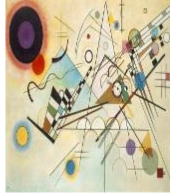
صورة (١٠) توضح تأثير تصميم كرسي المدخل بالإتجاه التجريدي الهندسي في الفن التشكيلي

تصميم الكرسي بعض عناصر الإستلهاً من مدارس الفن التشكيلي للعمل الفني المجاور فنحقق الوحدة في التصميم وهي التي تزيد قوة وجمالاً ( رأي الباحثة ) . أثرت مدارس الفن التشكيلي المعاصر على تصميم الكرسي فنلاحظ أثر للإتجاه التجريدي الهندسي والإتجاه التكعيبي وفن البوب وكذلك بعض الأعمال التشكيلية كما سنرى من تحليل بعض التصميمات الآتية :