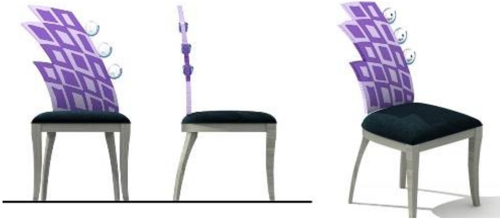
تصميم كرسي مدخل رقم (١٢)