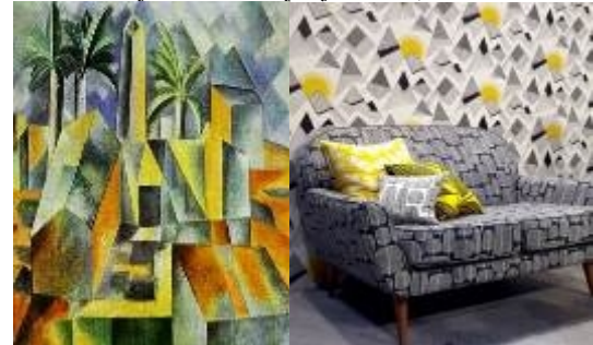
صورة (١٢) توضح تأثير تصميم كرسي المدخل بالفن التشكيلي في المدرسة التكعيبية .