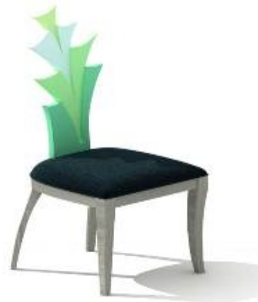
تصميم كرسي مدخل رقم (١٠)