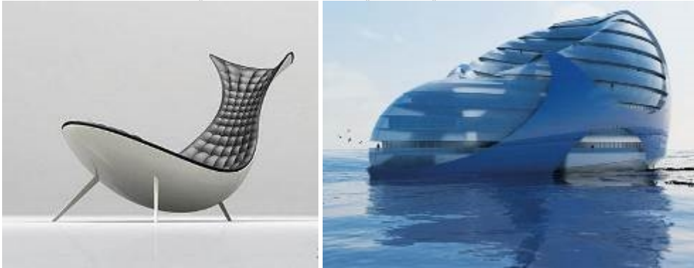
صورة (١٨) توضح العمارة العضوية المتأثرة بالكائنات البحرية وتصميم الكرسي المواكب لنفس الفكر التصميمي مما يؤكد على تأثير الطرز المعمارية على فلسفة تصميم الأثاث .