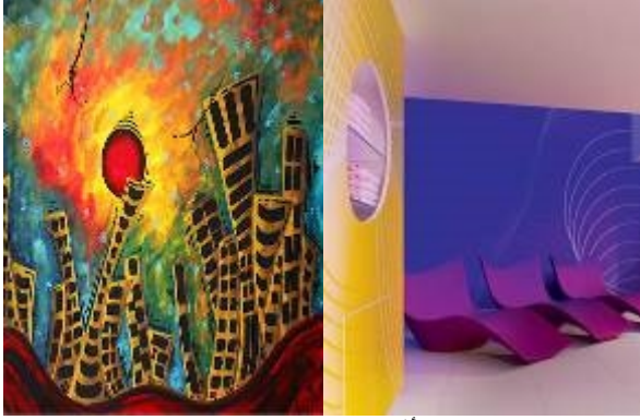
صورة (١٤) توضح تأثير تصميم كرسي المدخل بالفن التشكيلي في المدرسة السيربالية .