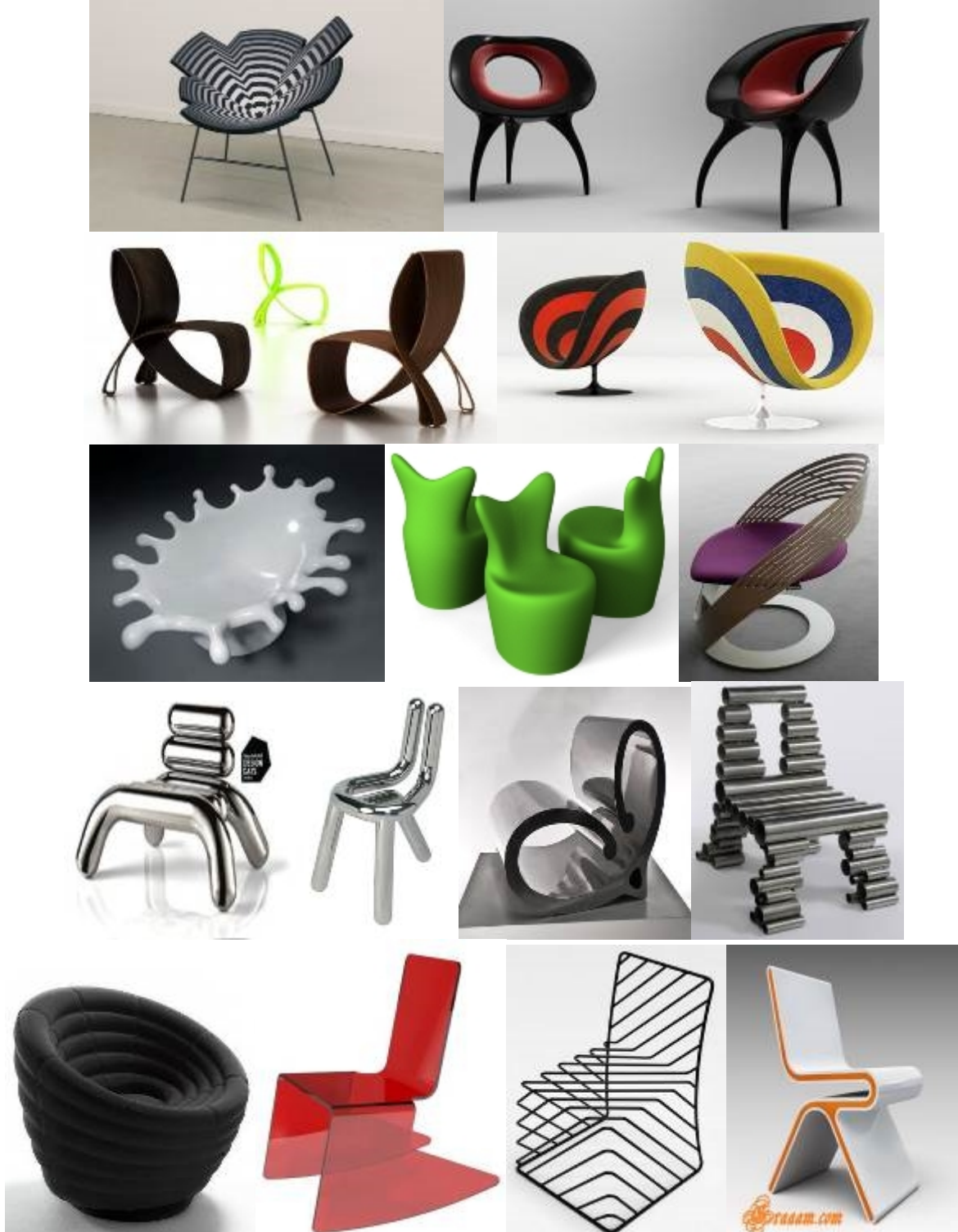
صورة (٩ب) توضح مجموعة لقطات لمقاعد أمريكية الصنع