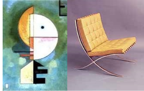
صورة (١١) توضح تأثير تصميم كرسي المدخل بالإتجاه التجريدي الهندسي في الفن التشكيلي .