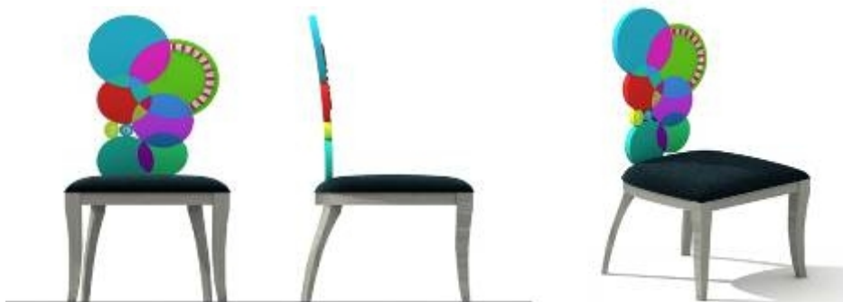
تصميم كرسي مدخل رقم (٣)