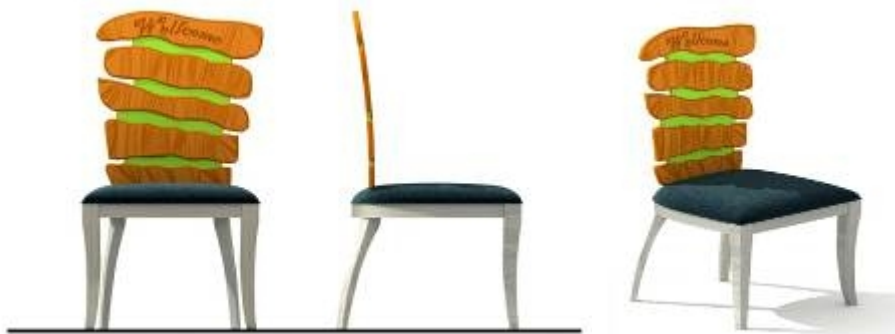
تصميم كرسي مدخل رقم (٢)