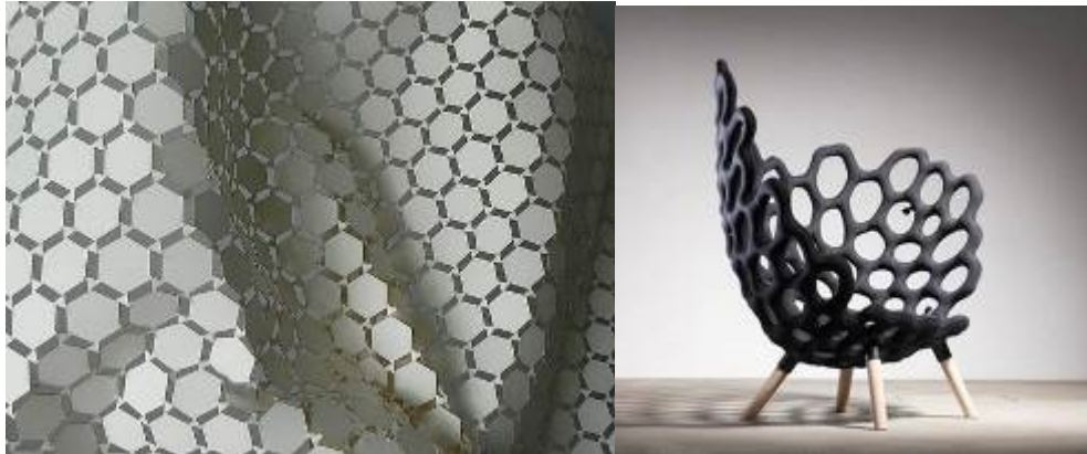
صورة (١٩) توضح العمارة العضوية المستلهمة من العناصر الطبيعية كخلايا النحل أو المركبات العضوية وتصميم الكرسي المواكب لنفس الفكر التصميمي والمصنوع من الخامات المخلفة القابلة للتشكيل مما يؤكد على تأثير الطرز المعمارية على فلسفة تصميم الأثاث (٣) .