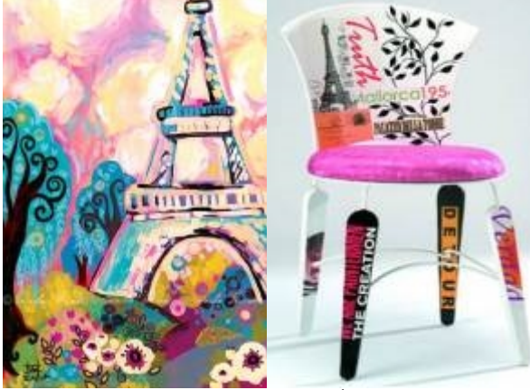
صورة (١٥) توضح تأثير تصميم كرسي المدخل بالفن التشكيلي لمدرسة البوب آرت والكولاج .